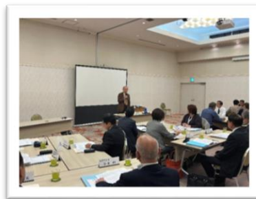
〔熱心に講義を聴く参加者〕